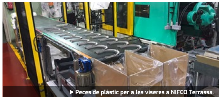
► Peces de plàstic per a les viseres a NIFCO Terrassa.

La multinacional NIFCO, dedicada al disseny, desenvolupament i fabricació de components termoplàstics per al sector de l'automòbil, amb seu a Terrassa, ha dissenyat, prototipat i construït un motllo d'injecció que permet fabricar viseres de protecció en sèrie. Un equip format per dos enginyers i tres tècnics del taller de motllos han aconseguit transformar la planta de Terrassa en una fàbrica capaç de realitzar 130 viseres de protecció cada hora.