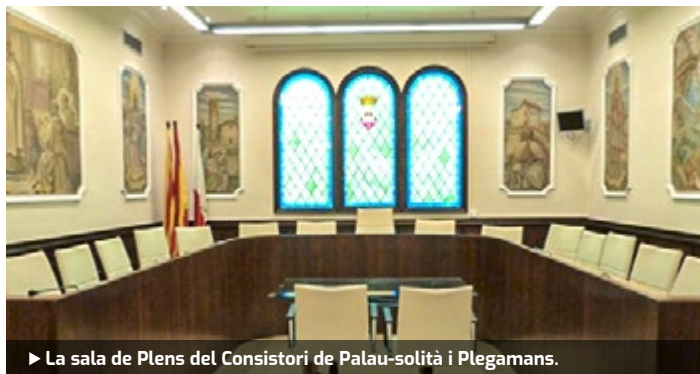
► La sala de Plens del Consistori de Palau-solità i Plegamans.

Tal com es va donar coneixement al ple ordinari telemàtic de març, l'Ajuntament de Palau es va adherir al Manifest #Aturemelcovid19 que han promogut conjuntament l'Associació Catalana de Municipis [ACM], la Federació de Municipis de Catalunya [FMC] i l'Associació de Micropobles de Catalunya [AMC] davant la situació excepcional que està vivint Catalunya i bona part del món. La voluntat del manifest és transmetre un missatge d'unitat i reivindicació del món local davant de la pandèmia global, demanar un confinament efectiu, alhora que posa l'accent en les eines, recursos i decisions necessàries