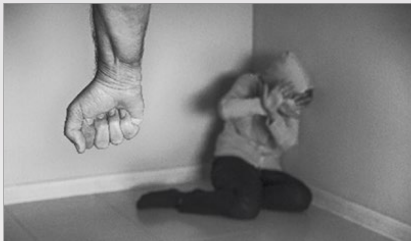
1r Classificat | Involúcrate | Josep M. Manteca

Aquest mes el tema de la Lliga és la « Foto Denúncia ». Les imatges parlen per si mateixes i diuen més que mil paraules. La foto dota la denúncia d'una forma portentosa i irrefutable, el que garanteix o busca garantir l'impacte sobre el denunciat. S'han presentat fotografies que són històries reals plasmades en imatges que es transformen en testimoni, però també s'han denunciat injustícies socials i ecològiques, i temes actuals, com la violència a través d'originals creacions fotogràfiques.