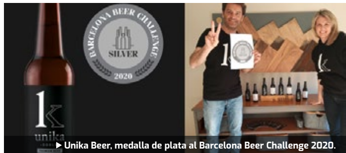
► Unika Beer, medalla de plata al Barcelona Beer Challenge 2020.

El principal concurs cerveser del sud d'Europa, el Barcelona Beer Challenge , on enguany hi han participat fins a 1.251 cerveses de tot el món, ha guardonat a una cervesera jove de Caldes de Montbui, Unika Beer , pels seus elevats estàndards de qualitat, amb la cervesa unika DOBLE , com una de les millors cerveses dins la seva categoria, Amber Malt European Lager . Degut a l'excepcionalitat del moment, la gala s'ha celebrat telemàticament i retransmesa a través de Youtube live.