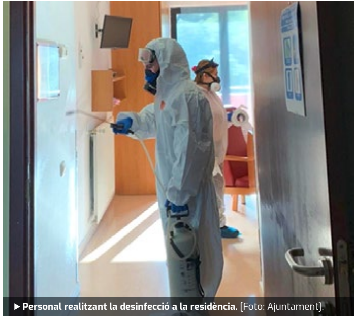
► Personal realitzant la desinfecció a la residència. (Foto: Ajuntament).

El passat 6 d'abril, l'Ajuntament va comunicar que, amb l'objectiu de la mesura és lluitar contra el contagi per la Covid-19, la residència geriàtrica «Residencial Palau», conjuntament amb l'Ajuntament, havien demanat al Departament de Treball, Afers socials i Família, la desinfecció interior de d'aquestes instal·lacions. En concret, es va sol·licitar que es prenguin les mesures per poder desinfectar la residència amb urgència per lluitar contra els possibles contagis.