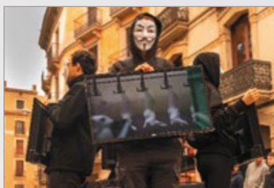
3r Classificat | Indústria animal | Isi Jurado