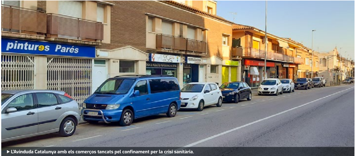
► L'Avinyó Catalunya amb els comerços tancats pel confinament per la crisi sanitària.

Dins l'esperit de col·laboració per cercar solucions consensuades en benefici dels ciutadans i ciutadanes i l'àmbit econòmic de la vila, el PSC de Palau vol proposar al govern municipal l'adopció d'una sèrie de mesures en l'àmbit de política fiscal per pal·liar els efectes del coronavirus Covid-19 sobre l'economia local i els col·lectius més vulnerables de la societat.