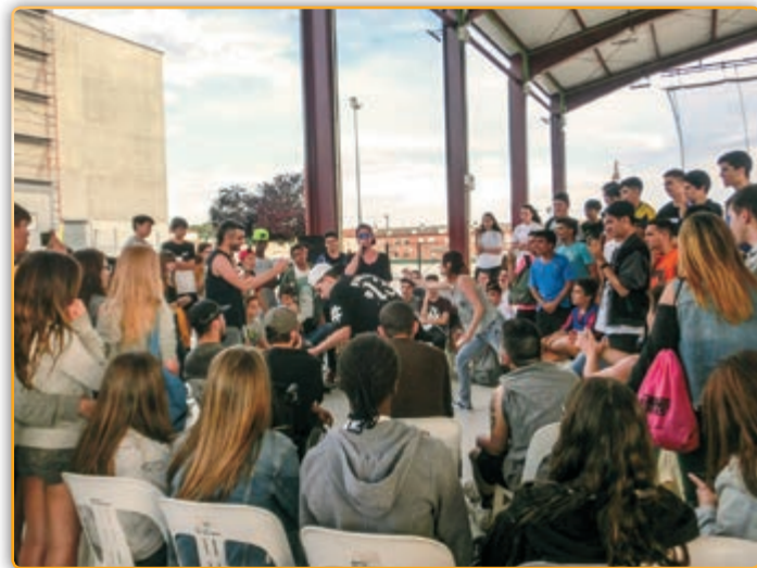
• Moments de celebració a l'estil «rap».

de vuit nois rapejaven competint entre ells. Ja al vespre i a l'exterior de l'Escorxador es va fer el Sopar de traje, amb una trentena de comensals. Després vindrien els Monòlegs de la Vagina que van fer pair el menjar entre riures i reflexions. Els timbals i ritmes de la Festukada van introduir la música i el ball, abans que comencessin els concerts de diversos grups que toquen al Galliner. Cul de Sac, Megalomania, Macallan, Polivar & Rutch, Benito Camela i Big Band Crew van fer que el bon ambient de la festa s'allargués fins ben entrada la matinada.