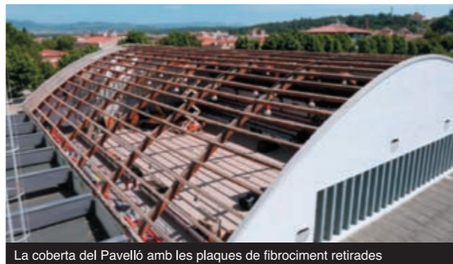
La coberta del Pavelló amb les plaques de fibrociment retirades

Ben aviat, quan disposem d'aquests recursos, endegarem diverses actuacions de millora de l'espai públic arreu de la vila.