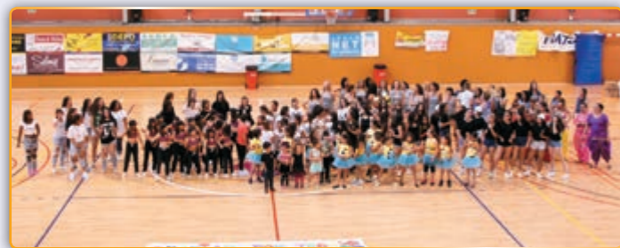
• Els participants de la Festa de l'Esport 2016.