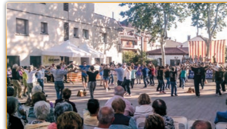
• Moment de ball a l'aplec.

A l'acte que enguany organitzava l'Agrupació Sardanista de Palau, hi participaven tres cobles de reconegut prestigi: la Marinada, la Sant Jordi i la Ciutat de Barcelona.