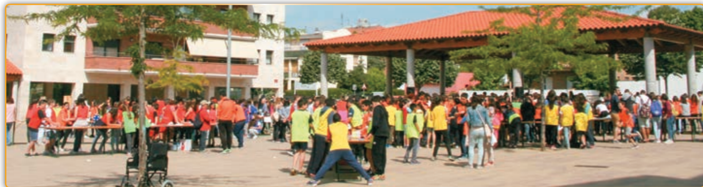
• Vista general de la 5a. edició de les Gincanàtiques.

Amb motiu del Dia Escolar de les Matemàtiques, que es celebra el dia 12 de maig, al voltant de 300 escolars que estudien 6è de primària i 1r d'ESO a tots els centres educatius de la vila van omplir la Plaça de la Porxada per prendre part a la cinquena edició de les Gincanàtiques, un joc didàctic que enguany girava en torn a la geometria. Es tracta de proves amb contingut matemàtic que uns alumnes plantegen per tal que altres ho resolguin. Passat un temps, s'intercanvien els papers, els grups que plantejaven el problema passen a resoldre la prova i viceversa.