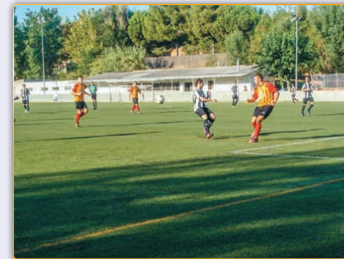
• Imatge d'arxiu del F. C. Palau.

Per altra banda, des del passat dia 3 resten obertes les inscripcions per a la temporada 2016-2017 i, segons els responsables de l'entitat amb força èxit. Segons diuen, la possibilitat que els jugadors puguin triar el número i posar