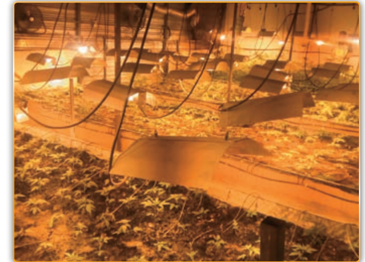
• Part de la marihuana trobada a la plantació.

En el moment en que van interrompre els membres de la comitiva de la Guardia Civil, a la nau hi havia plantades al voltant de 2.500 plantes, les quals estaven en un estat de desenvolupament que abraça tot el cicle vegetatiu, és a dir, des de planters recent plantades, fins a plantes ja cultivades i a punt per tallar. Segons fons consultades per aquesta revista, el preu final de mercat d'aquesta plantació podria situar-se entre els 5 i els 7 milions d'€, en funció del país en que es volgués col·locar el producte. Sembla ser que "els potencials receptors o grans distribuïdors" del mercat espanyol són dels que menys paguen pel producte final i