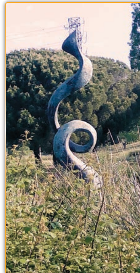
• Estat actual del monument.