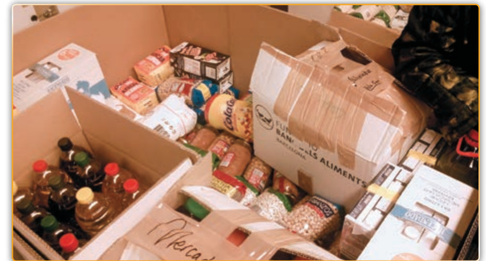
• Alguns dels aliments recollits a la campanya d'enguany.

La majoria de productes recollits foren llet, llegums, fruits secs... tot i que els organitzadors «haviem demanat que, si es podia, ens donessin llegums cuits, perquè hi ha moltes famílies que no tenen recursos pels serveis de gas, electricitat, etc. per cuinar. També havíem demanat productes en els que normalment no es pensa, sabó per higiene personal, per a la roba, pels plats, pels nens...». Al final, la resposta ha estat tant positiva. Diuen que molt més que l'any passat, que algú dels voluntaris fins i tot s'atreveix a donar un percentatge respecte a la resposta