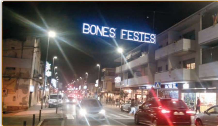
• Les llums nadalencs fan caliu al Nadal.