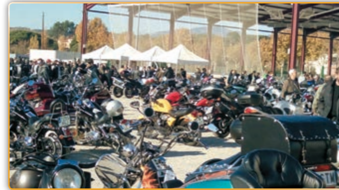
• Impressionant imatge de la concentració de motos.

El passat diumenge, dia 29 de novembre es va desenvolupar una matinal solidària, una gran concentració de motocicletes de gran cilindrada que van acabar omplint l'espai que circumda els pavellons esportius de Palau. La matinal solidària estava organitzada per ADISPAP (Associació de Persones amb discapacitat de Palau-solità i Plegamans) i l'Associació Rodes Solidàries (Ajuda a los afectados por enfermedades minoritarias). També participava l'Ajuntament de Palau-solità i Plegamans. Des de la primera hora del matí es va posar en marxa una barbacoa i un bar perquè tots els assistents, els motoristes i acompanyants que participaven a la concentració o els