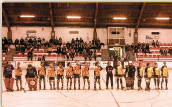
• L'equip sub-16 del Generali Palau.

La darrera setmana complerta (23-29) del mes de novembre fou altament fructífera per l'equip femení d'hoquei de Palau, ja que abans d'enfrontar-se en el seu debut europeu a l'equip suís de Montreux (del que parlem a banda), les noies del Palau van viure uns dies plens i també satisfactoris.