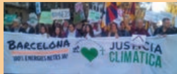
Barcelona, 29 de novembre, manifestació cimera climàtica

El clam: assolir acords vinculants que permetin reduir les emissions de gasos contaminants per evitar que la temperatura del planeta augmenti més de dos graus aquest segle