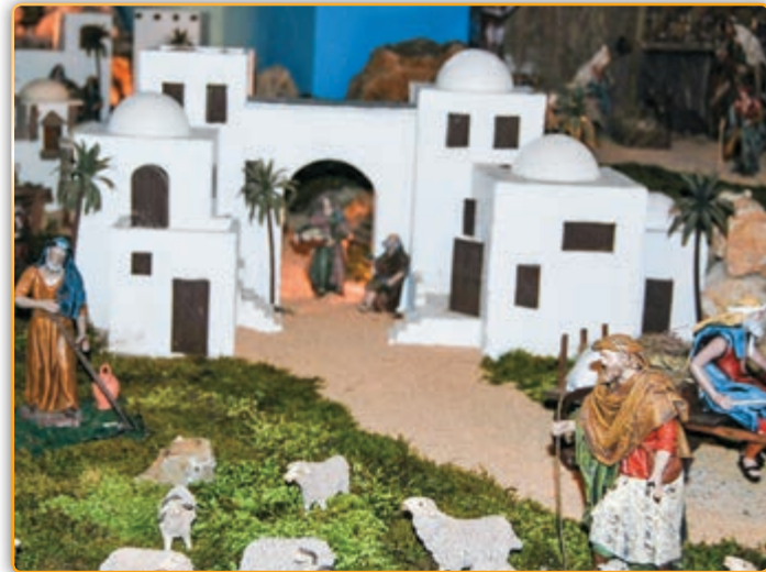
• Un dels pessebres de l'any anterior.