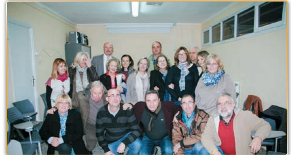
• Part organitzativa de les Nades 2014.

En principi, els organitzadors tenien previst realitzar l'acte de lliurament dels premis als guanyadors de les cinc categories diferents ( per edats fins a 5, 7, 9,12 i adults) i també a la resta de participants, el pròxim mes de febrer, tal i com s'havia fet en anteriors edicions, però enguany