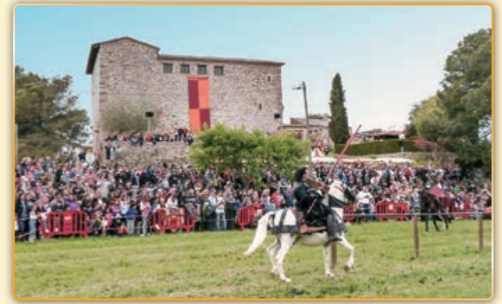
• A punt de començar el torneig medieval.

I dintre dels ingredients que ofereix el mercat amb exhibicions de falconeria, jocs, cercaviles, espectacles música i dansa i altres atractius que omplien la variada oferta d'oci, diversió i cultura, enguany també es va organitzar una cloenda final diferent a anteriors edicions. Es tractava d'un sensacional espectacle pirotècnic amb el Castell de Plegamans com a protagonista a la tarda-nit del diumenge. Aquest nou fi de festa va suposar que s'avancés a la tarda de dissabte el Torneig Medieval amb cavalls, que un any més va ser un dels actes amb més públic. També el mateix dissabte es va estrenar un nou espectacle de foc i malabars. Com a novetat, el Taller de les Arts va organitzar una marató de dibuix a diversos indrets del municipi. Tot combinat amb l'animació i representacions de carrer i les actuacions organitzades per entitats del municipi, des de la ballada dels Geganters i Grallers fins al correfoc dels Deixebles del Dimoni de la Pedra Llarga, passant per les gralles del Ramat, els balls del Centre Cultural Andalus, les havaneres dels Escamarlans de Palau, etc.