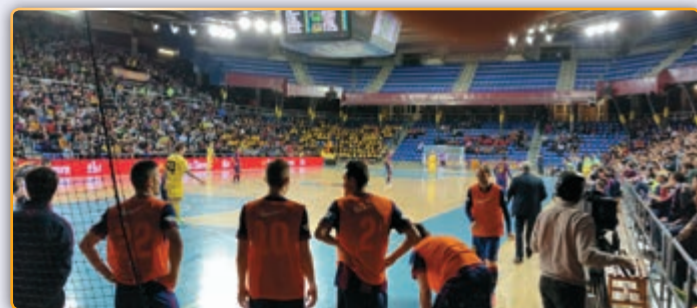
• El Palau Blaugrana, en un moment del partit.

El divendres 27 de març gran part dels integrants dels diferents equips de l'entitat del Futbol Sala Palau, concretament 170 entre jugadors i tècnics van omplir tres autocars de l'Empresa d'autocars Serrat per desplaçar-se fins a les instal·lacions esportives del F.C. Barcelona. Concretament anaven al Palau Blaugrana per tal de conèixer in situ una gran entitat esportiva i els diferents aspectes que l'envolten. A banda de veure les instal·lacions i altres aspectes de l'entitat blaugrana, els integrants de l'expedició palauenca van poder gaudir d'un altre ingredient més. Fou la cirereta que faltava al pastís per poder completar un dia de plena satisfacció pels més joves. Els expedicionaris van poder assistir a un partit de l'elit de la Liga Nacional de Futbol Sala (LNFS). Aquell dia jugava el Barcelona contra el Jaen Paraiso Interior, equip que, per altra banda, havia guanyat contra tot pronòstic la setmana anterior al F.C. Barcelona a la final de la Copa del Rei. Els nois d'en Carmona però es van refer de la derrota i van endossar quatre gols a l'equip andalús. Els responsables de l'entitat palauenca consideren que la sortida ha estat molt positiva per als nois, especialment per als més petits que han pogut veure i gaudir de tot plegat. Consideren que ha estat una bona experiència que els servirà d'exemple a seguir per continuar practicant l'esport del futbol sala.