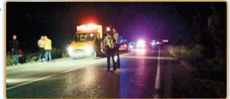
• Accident a la Ctra. de Caldes a Palau amb un porc senglar.