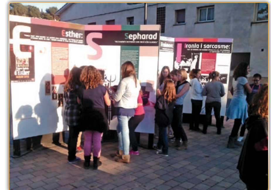
• Un grup d'alumnes de l'Escola Marinada visitant l'exposició

Sota el títol «Espriu a l'àgora, una lectura visual de l'escriptor», l'exposició està estructurada en 15 panells en els que recull part de l'obra i la figura d'en Salvador Espriu. La idea és, a banda de donar a conèixer l'escriptor, és la d'impulsar la lectura de l'obra i el llegat d'un dels escriptors més rellevants de les lletres catalanes. La seva exemplaritat i la seva actitud en una de les situacions més adverses per a Catalunya, es sintetitza, segons els organitzadors, en les seves paraules: «Ens mantindrem fidels per sempre més al servei d'aquest poble». Segons diuen, constitueix un llegat que ha de romandre a la memòria dels catalans.