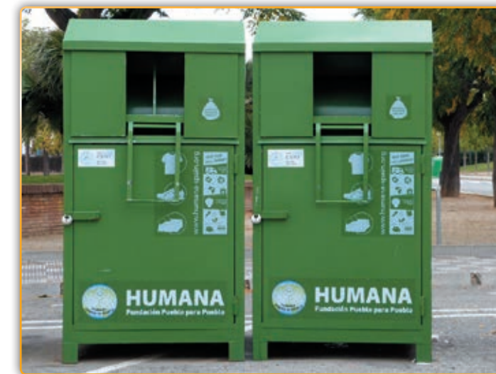
• Els contenidors de l'Organització Humana.