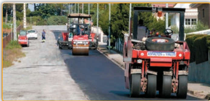
• Treballs d'asfaltament del carrers a Can Duran.