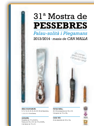
• Cartell de la 31ª Mostra de Pessebres.

Espectacle Teatral Familiar: L'AUCA DELS PASTORETS DEL PESSEBRE el Diumenge 1 de desembre a les 12:00 del migdia. Espectacle Gratuït al Teatre de la Vila.