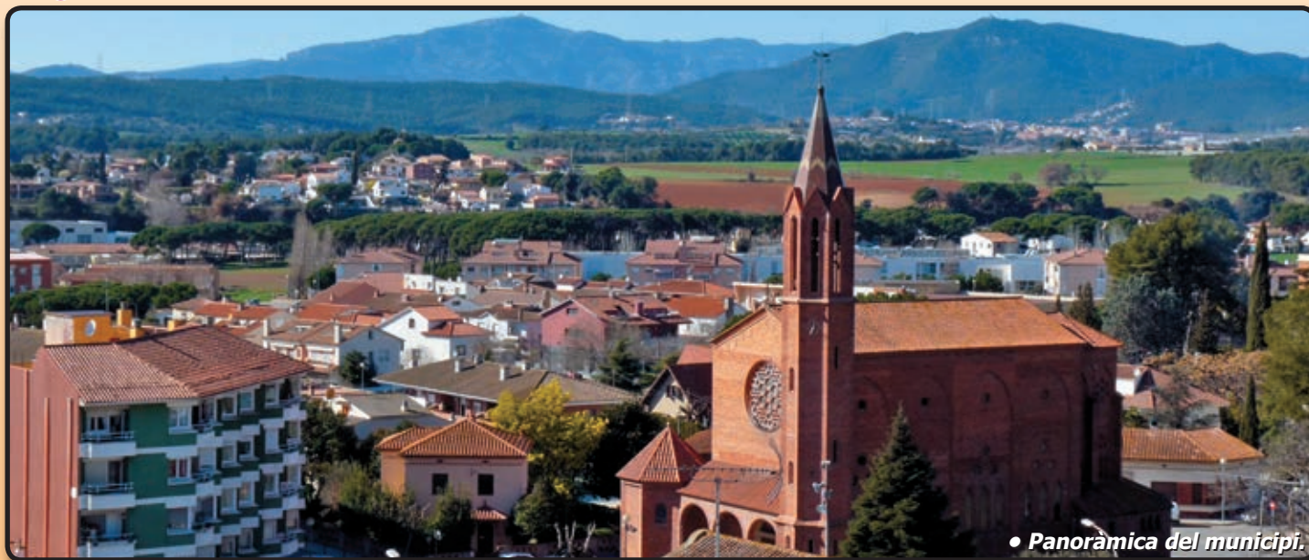
• Panoràmica del municipi.