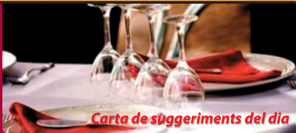
Carta de suggeriments del dia

Menú diari 1 [3 primers, 3 segons amb postre, beguda i cafè]... 15€ [I.V.A. inclòs]