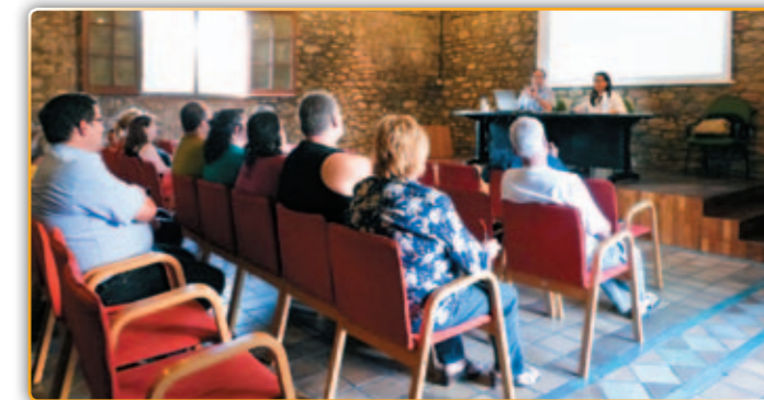
• Una de les xerrades explicatives del POUM.

Ara als responsables del document les queda una quinzena intensa per explicar el document a la resta de sectors. Aquest mateix dimecres, dia 17, ho faran per a Can Duran, El dia 19 serà el torn de Can Falguera i Els Turons, mentre