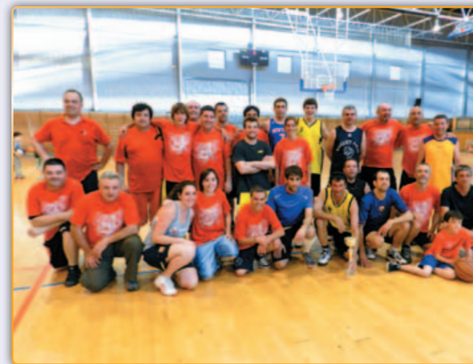
• Veterans i col·laboradors del club.

El dissabte, dia vuit de juny, al pavelló Maria Víctor es va celebrar la sisena edició del torneig, Vila de Palau amb el que l'entitat esportiva dona per tancada la temporada. A l'