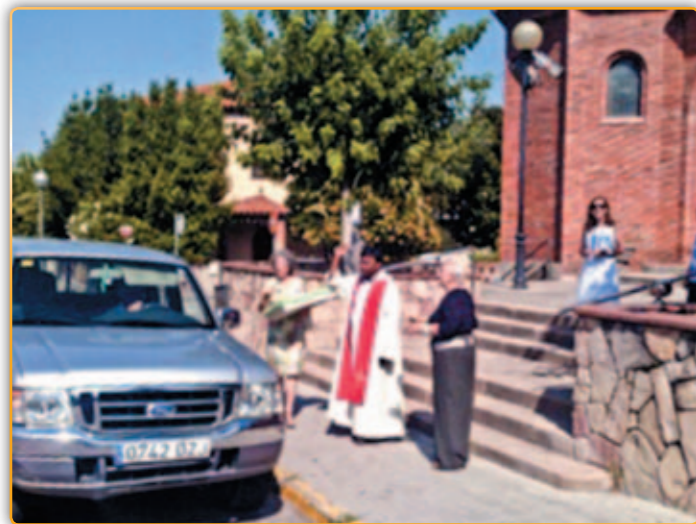
• Moment de la benedicció.

El passat cap de setmana, molts/tes palauencs/ques van complir amb la tradicional benedicció del seu cotxe amb motiu de la celebració de la diada de Sant Cristòfol, patró dels conductors. Malgrat que el dia de la tradicional festa del patró dels viatgers i dels automobilistes ja havia estat uns dies abans, Mossèn Prakash Chukka va voler dur a terme l'acte de la benedicció dels vehicles el dissabte,