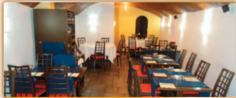
• Interior del restaurant El Caliu.