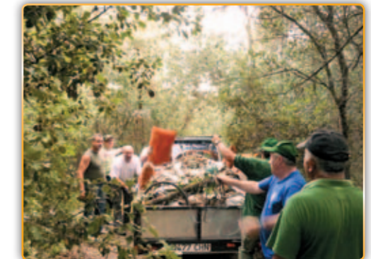
• Carregant el camió després de la neteja.

Amb altres temes, des de la Societat de Caçadors de l'Alzina, volem destacar i agrair les gestions realitzades aquesta temporada pel nostre guarda de camp, i del cos d'Agents Rurals amb diferents actuacions i expedients sancionadors realitzades a persones alienes de la nostra societat en caça furtiva, com la col·locació de xarxes japoneses per capturar ocells fringíl·lids, i de persones que aprofiten quant passen el dia a Palau, per capturar ànecs de la riera durant el període de cria. Aquests fets i d'altres son perseguits amb ma fer-me per la societat, que no dubtarà en denunciar a qualsevol persona ja sigui de la pròpia societat o fora d'ella en el incompliment de la llei de caça i de la llei de protecció dels animals.