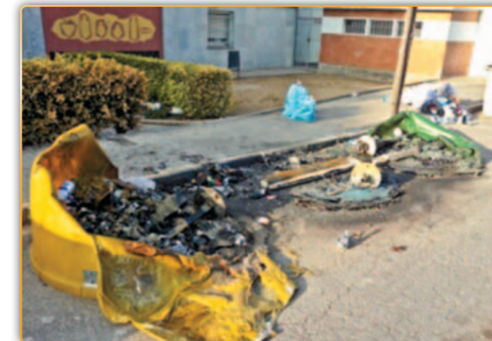
• El foc es va emportar els contenidors del carrer Colom.

En aquest sentit cal destacar únicament dos focs, un d'ells fou una bardissa dels jardins de Can Cortès, mentre que fou un petit incendi en un camp proper al centre, que també es va apagar de seguida. Major transcendència va tenir el foc que va cremar un total de quatre contenidors de recollida selectiva ubicats al carrer Colom i d'un petit dipòsit de piles situat al passeig de la Carrerada. L'incendi d'un dels contenidors de recollida selectiva va malmetre «les peces de plàstic d'un cotxe que estava estacionat al costat», detalla Gràcia. Segons el sotsinspector, «en aquest cotxe va haver-hi els únics danys provocats a tercers que es van registrar».