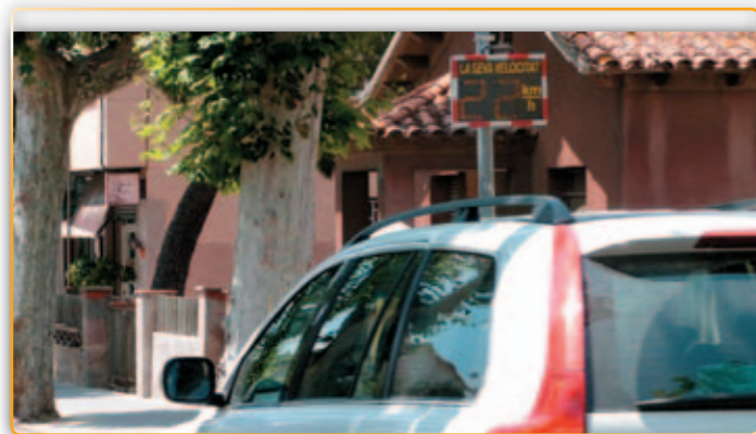
• Un plafó lluminós marcan la velocitat del vehicle...

Prop de la meitat dels vehicles que circulen per l'Avinguda Catalunya infringeixen els límits de velocitat establerts o, el que és el mateix, circulen a major velocitat de la permesa en el punt en el que estava col·locat el plafó indicador que s'havia situat a l'alçada del número 157 de la citada via. Aquest plafó lluminós situat a la principal arteria del municipi que registrava les dades dels vehicles que circulaven direcció Barcelona, va comptabilitzar el pas de 40.801 cotxes durant els dies en que va estar instal·lat. D'aquells