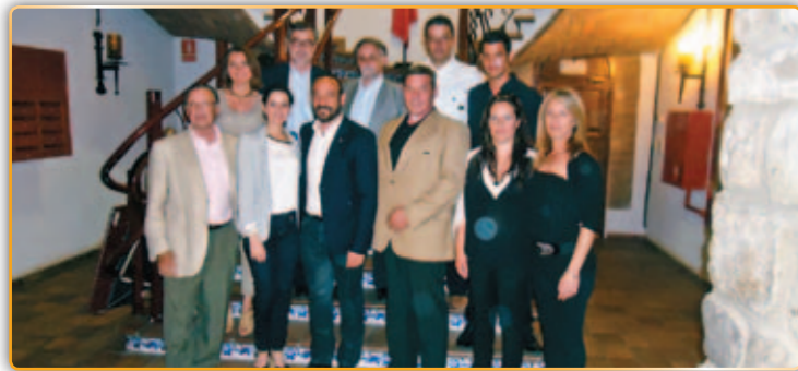
• Els militants de Ciutadans, partit que lidera Albert Rivera.