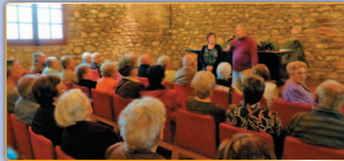
• Xerrada per a la prevenció de robatoris contra la gent gran.

Aquesta Xerrada es complementarà amb l'edició d'un díptic que recull tots els consells i contingut de la xerrada i que serà distribuït entre la gent gran al llarg de la propera setmana.