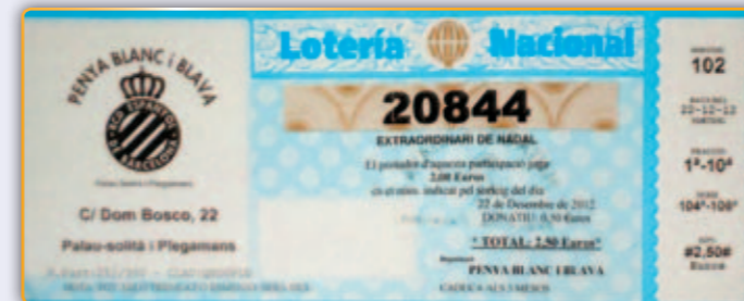
• La loteria de la penya per el sorteig extraordinari de Nadal.

Els responsables de la Penya Blanc i Blava Javi Màrquez de Palau, han convocat a tots els socis de l'entitat per aquest dia 18 per tal que prenguin par a la junta extraordinària. A la reunió es debatran una sèrie de punts en que els responsables volen que els socis diguin el seu parer sobre una sèrie d'aspectes.