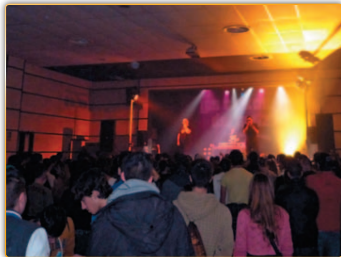
• Actuació de "Los Chikos del Maíz".

El grup de música Chikos del Maíz va oferir el passat dia 9 de novembre a la Sala Polivalent de Palau el concert que s'havia anul·lat durant la festa major per deficiències a la tarima en la que havien d'actuar el grup. En una nit que finalment acabaria essent plujosa, els nois van oferir als seus incondicionals, al voltant d'uns 150 joves (dintre i l'aforament de la sala), les seves cançons moltes d'elles