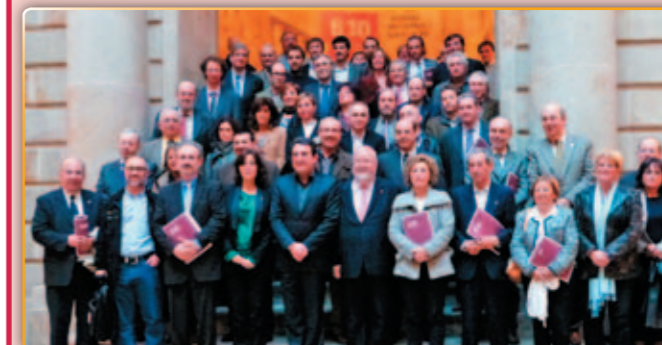
• Presentació a Barcelona dels 23 municipis de la B-30

Els 23 municipis que conformen l'associació són Badia, Barberà, Castellar, Castellbisbal, Cerdanyola, el Papiol, Granollers, la Roca, Martorell, Mollet, Montmeló, Palau, Parets, Polinyà, Ripollet, Rubí, Sabadell, Sant Cugat, Sant Quirze, Santa Perpètua, Terrassa i Vilanova del Vallès. Unes poblacions que abarquen 485 quilòmetres quadrats de superfície a la que s'ubiquen 195 polígons amb 6.579 hectàrees industrials. En total, aquesta àrea acull 30.173 empreses que donen feina a 387.478 treballadors.