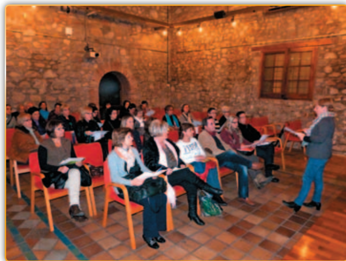
• Assistents a l'edició del Voluntariat per la llengua.

El darrer dia d'octubre, dimecres dia 31 i en un acte desenvolupat a l'auditori de Can Cortès es va iniciar la 18 ena edició de Voluntariat per la llengua. L'acte va deixar dues coses ben paleses. Per un costat la bona salut que gaudeix el programa al municipi palauenc i, per altra banda, l'acceptació per part dels nous alumnes d'una iniciativa que