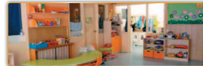
• Aula d'una escola bressol.