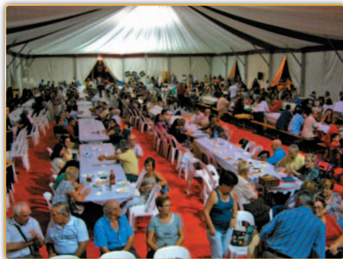
• Sopar a la carpa a la 9ª Edició de Nit de l'Illa.

La 9ª Nit de l'Illa d'enguany desenvolupada el dissabte dia 25 del passat mes de setembre a la carpa situada al costat del pavelló municipal, va aplegar un gran nombre de persones que els organitzadors, l'Associació de comerciants, Illa Comercial Palau, quantifiquen al voltant de les 1500 persones. Aquestes van gaudir d'un sopar gratuït i a elles