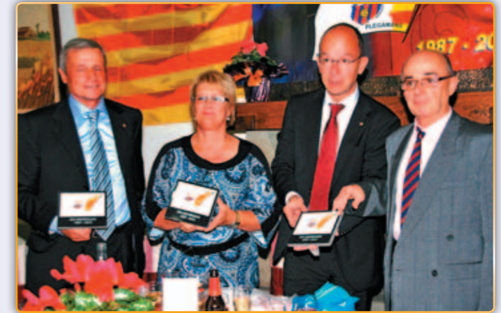
• Plaques commemoratives al 25è aniversari de la Penya.

Aquest acte del divendres va estar-hi farcit d'altres iniciatives com la participació d'altres entitats culturals palauenques