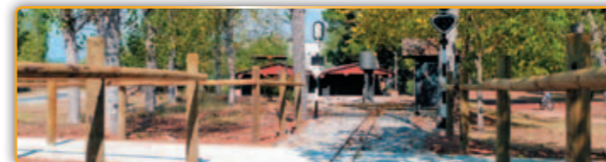
• El nou pas a nivell a l'Hostal del Fum.

L'Ajuntament de Palau ha finalitzat les obres de construcció d'un nou accés al Parc de l'Hostal del Fum des de la Ronda Verda que voreja la Riera de Caldes.