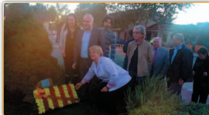
• Moment de l'ofrena floral al monument de Companys

L'acte, celebrat a la plaça Lluís Companys va estar presidit per l'alcalde de Palau que estava acompanyada dels diferents regidors del consistori i dels representants dels diferents partits del municipi amb representació a municipal