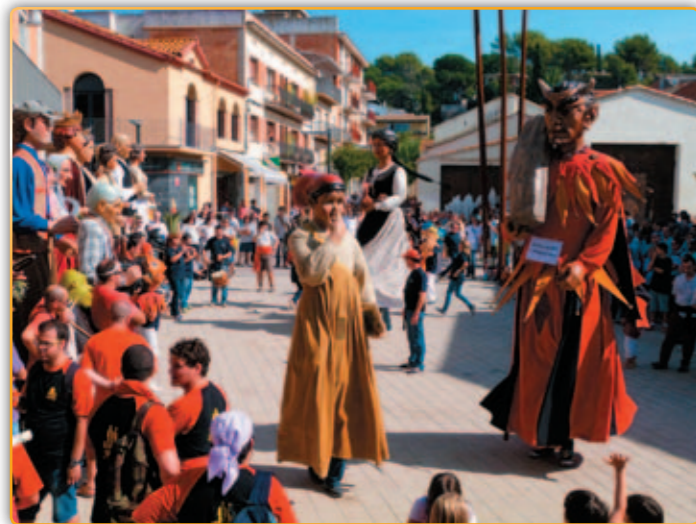
• La festa de la Trobada Gegantera...

La X Trobada Gegantera organitzada per la Colla dels Geganters i Grallers de Palau va aplegar el diumenge 7 d'octubre al voltant d'un miler de persones en una festa en la que hi van prendre part 15 colles geganteres i gralleres arribats de diferents punts de Catalunya. En total