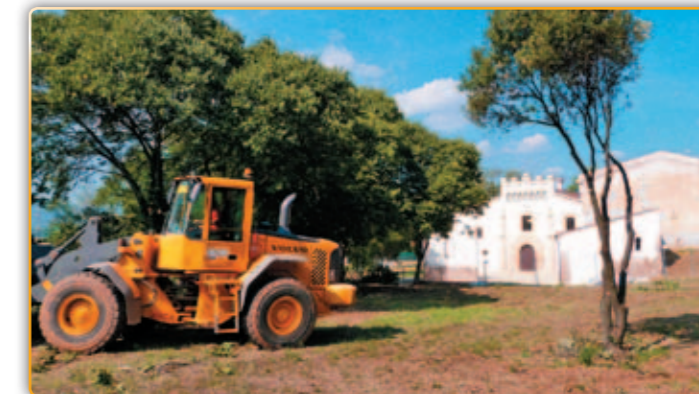
• Començament de les obres a l'entorn de la Masia de Can Falguera.

Durant aquests darrers anys s'han realitzat una sèrie de treballs a la masia que estava pràcticament a terra i en unes condicions deplorables. Després de l'elevada xifra allà invertida, 2.123.000€. l'edifici ha recobrar quasi totalment la seva fisonomia d'antany. Els diners però s'han acabat i altres partides pressupostàries necessàries per acabar les obres de recuperació no arriben. La recessió econòmica també afecta la iniciativa de recuperació endegada i les