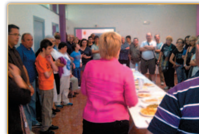
• Acte inaugural del Centre Cívic.

El nou Centre Cívic es va inaugurar el 23 de setembre després que l'Ajuntament fes treballs d'adaptació i rehabilitació en