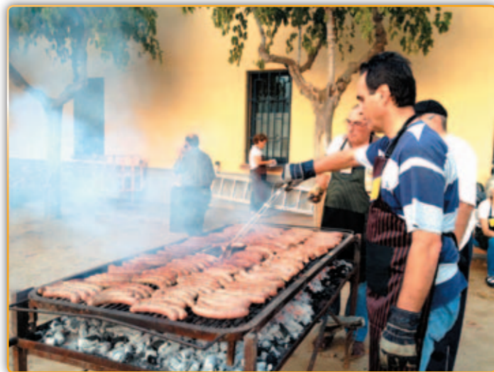
• Botifarrada al festival contra el càncer.

Al voltant de mig miler de persones van acudir al Gran Festival Catalunya contra el Càncer organitzat per la Junta Local de Palau i que es va celebrar la nit del dissabte dia 6 a la plaça de la Vila. L'acte tenia com a finalitat bàsica la recaptació de fons per a la lluita contra aquesta malaltia que afecte cada vegada la nostra societat.