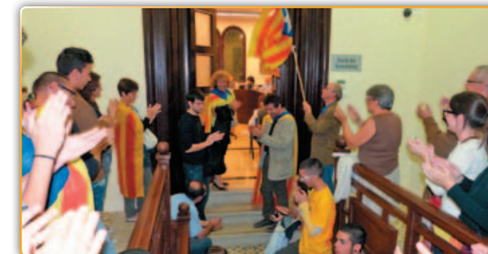
• Imatge del Ple multitudinari "per la independència".