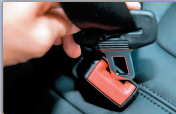
• El cinturó de seguretat pot salvar-te la vida.

Per controlar l'ús del cinturó de seguretat i altre elements com el casc i les cadiretes infantils, al llarg el mes de setembre es va dur a terme una campanya de control de l'ús d'aquests elements. Els resultats han estat positius, ja que només s'ha detectat una infracció entre tots els vehicles objecte del control.