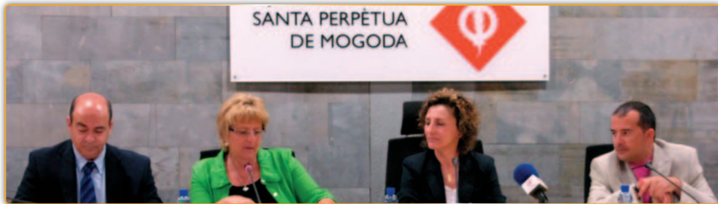
• Signatura del conveni amb els altres municipis.

L'Ajuntament de Palau i altres tres ajuntaments de l'àrea del Baix Vallès, conca Riera de Caldes, van signar el passat dia quatre de juliol, un conveni de col·laboració que té com a finalitat bàsica desenvolupar el projecte pilot, Exportes?