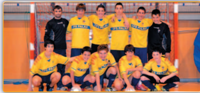
• FSP - Cadet A