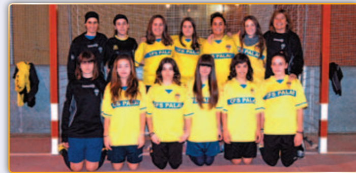
• FSP - Cadet Femení.

L'objectiu dels responsables del Club no és un altre que el retorn d'aquest equip novament a la categoria que va perdre la temporada passada. Per assolir aquest desig, els responsables es marcant un període màxim de dos, tres anys.