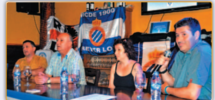
• A l'assemblea general...

com podria ser un partit de futbol entre els socis respectius, etc.