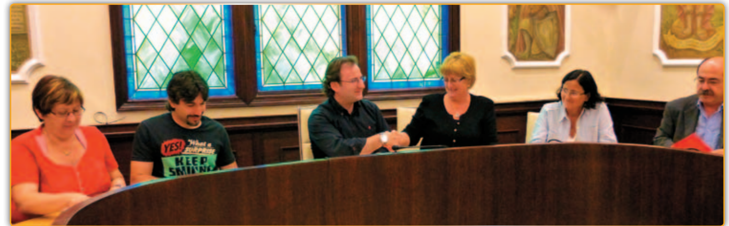
• Lliurament de l'Estudi de Camins Escolars.

Aquestes dades, recollides a l'estudi sobre els Camins Escolars realitzat per l'àrea d'infraestructures i urbanisme de la Diputació de Barcelona que el diputat responsable,