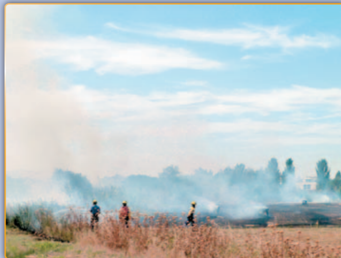
• Els bombers intentant sofocar el foc.

És possible que les altes temperatures hagin provocat una combustió espontània de les bales de palla que hi havia al camp. També s'investiga si podria estar descartar que hagi estat intencionat.