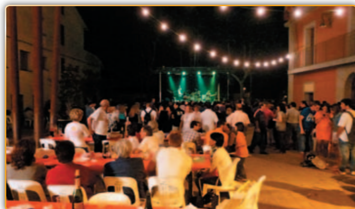
• Palaencs gaudint del sopar i de la revetlla.

Amb una mica de retard des d'aquell dia, el passat dissabte 23 de juny, Palau va celebrar la revetlla de Sant Joan, amb un municipi ple de música i amb quasi una total absència d'incidentes. Segons fons municipals, únicament tres contenidors cremats i alguns matolls incendiats, però que van poder ser apagats a temps. Tot això després dels actes anteriors al sopar i de la festa posterior. Abans es van desenvolupar els típics actes d'aquell dia, això sí, amb una notable participació ciutadana que va assistir-hi a veure els balls de gitanes, de sardanes i dels gegants a la plaça de la Vila, a la lectura del missatge de la Flama del Canigó per La Societat Coral La Unió i a l'encesa de la foguera a l'esplanada annexa del Pavelló.