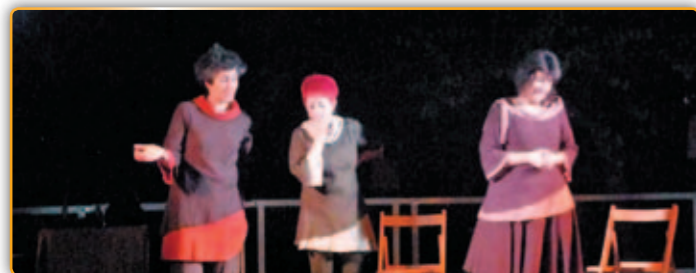
• El grup en plena actuació.

Al voltant d'un centenar de persones es van donar cita als jardins de Can Cortès el passat divendres dia sis de juliol per escoltar els relats, els contes que de manera teatralitzada el grup 3d3 presentava en torn al número 7. Segons elles, 7 son els pecats capitals, 7 virtuts, 7 vides té un gat, 7 colors té l'Arc de Sant Martí, 7 dies de la setmana, 7 barrufets de la Blancaneus, 7 de juliol Sant Fermí.