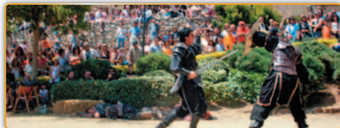
• Lluita al Mercat Medieval l'any 2009.

El darrer cap de setmana d'aquest mes de maig, Palau tornarà als seus orígens o, dit d'altra manera, a recordar èpoques del seu passat amb el mercat medieval que s'organitza els dies 26 i 27 als voltants del Castell de Plegamans. I la festa medieval també tornarà als seus orígens ja que es desenvoluparà novament en les dates inicials en les que sempre s'havia dut a terme, excepte el passat any que, per interessos electorals, el govern municipal que encara presidia l'ex alcaldessa, Mercè Pla va avançar la festa quasi un mes.