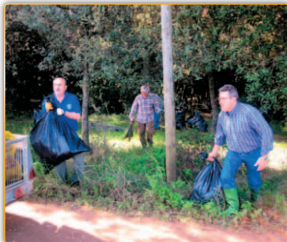
• Els caçadors en plena feina de neteja.

El passat dia 5 de maig, els membres i socis de la societat de caçadors de l'Alzina de Palau van realitzar una primera neteja del bosc de la font de Can Pujol. Aquests treballs estan emmarcats dins de les activitats esportives i socials de la pròpia societat per aquesta temporada. Aquesta zona és molt utilitzada per famílies que vénen a passar el dia quan el bon temps acompanya, però per molt pocs és respectada, amb l'abandó indiscriminat de tot tipus de deixalles.