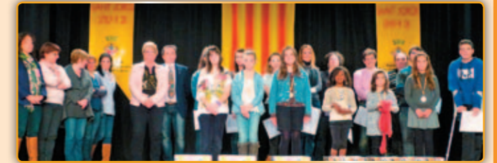
• Tots els premiats en la diada de Sant Jordi.