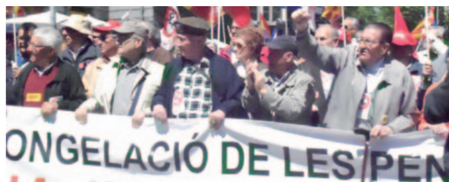
Companys pensionistes i jubilats a la manifestació de l'1 de maig

ICV va donar suport i va participar en la concentració del 29 d'abril, convocada pels sindicats contra les mesures del Govern central en matèria de sanitat, i en la manifestació commemorativa de l'1 de maig. Per ICV les polítiques de retallades que estan portant a terme tan el Govern central com el de la Generalitat estan ja superant tots els límits i suposen una pèrdua de drets per a la classe treballadora. Davant d'això, calen respostes massives contra aquestes polítiques i en defensa de l'estat del benestar.