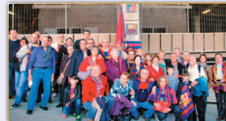
• Socis de la Penya davant de la placa commemorativa.