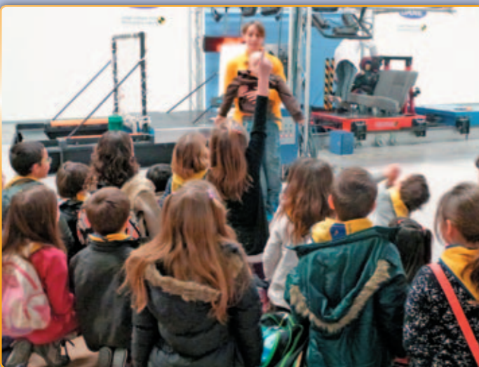
• Un agent fent classe d'educació viària

El programa d'Educació Viària que es desenvolupa a Palau des de fa molts anys, és possible gràcies al treball i a la col·laboració que duen a terme la Policia Local, els centres educatius i l'Ajuntament.