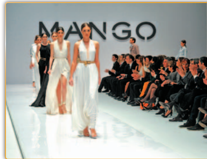
• Una de les desfilades de moda de Mango.

La firma de moda, Mango, multinacional catalana amb seu al polígon Riera de Caldes de Palau, ha decidit baixar en un 20% els preus de la seva roba i complementos la pròxima campanya per posar al mercat preus molt més competitius i per adaptar-se a la situació econòmica actual. Segons fonts de l'empresa palauenca, aquesta decisió no te res a veure amb la facturació de les vendes que malgrat