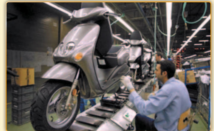
• Cadena de muntatge.

A darrera de tot el projecte, sembla que estaria un grup inversor suís que seria el que estaria disposat a fer una inversió inicial al voltant dels 100 milions d'euros a Palau. Amb la inversió es crearien al voltant de 400 llocs de feina i els inversors han pensat en les instal·lacions que tenia Yamaha a Palau i que ara han passat després de l'acord al que han arribat les dues firmes, al grup logístic Sesé que, en principi i a l'hora de tancar aquesta revista, diuen no tenir contacte amb cap grup. De totes maneres i segons el diari econòmic Expansión, el grup inversor estaria disposat