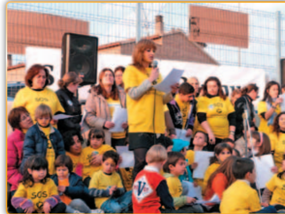
• Protesta reivindicativa a la jornada de portes obertes.

Aprofitant la jornada de portes obertes a l'escola de Can Periquet, un grup de persones (unes 200, segons l'Ajuntament) format especialment per pares dels alumnes del centre escolar, van protestar en contra de la decisió del Departament d'Ensenyament de no oferir places de P3 per al proper curs.