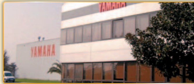
• L'antiga fàbrica Yamaha.

Tot i que la Conselleria d'Empresa i Ocupació de la Generalitat de Catalunya, en principi argumenta que és una mes de les moltes propostes d'inversió que rep cada setmana el Govern de la Generalitat,