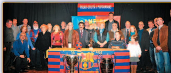
• La Penya al complet...

Una vegada més i com ja és habitual, any rere any, el conegut teatre de la vila municipal es va omplir de nes/nes, pares, familiars i socis de la Penya Barcelonista de Palau que en el decurs