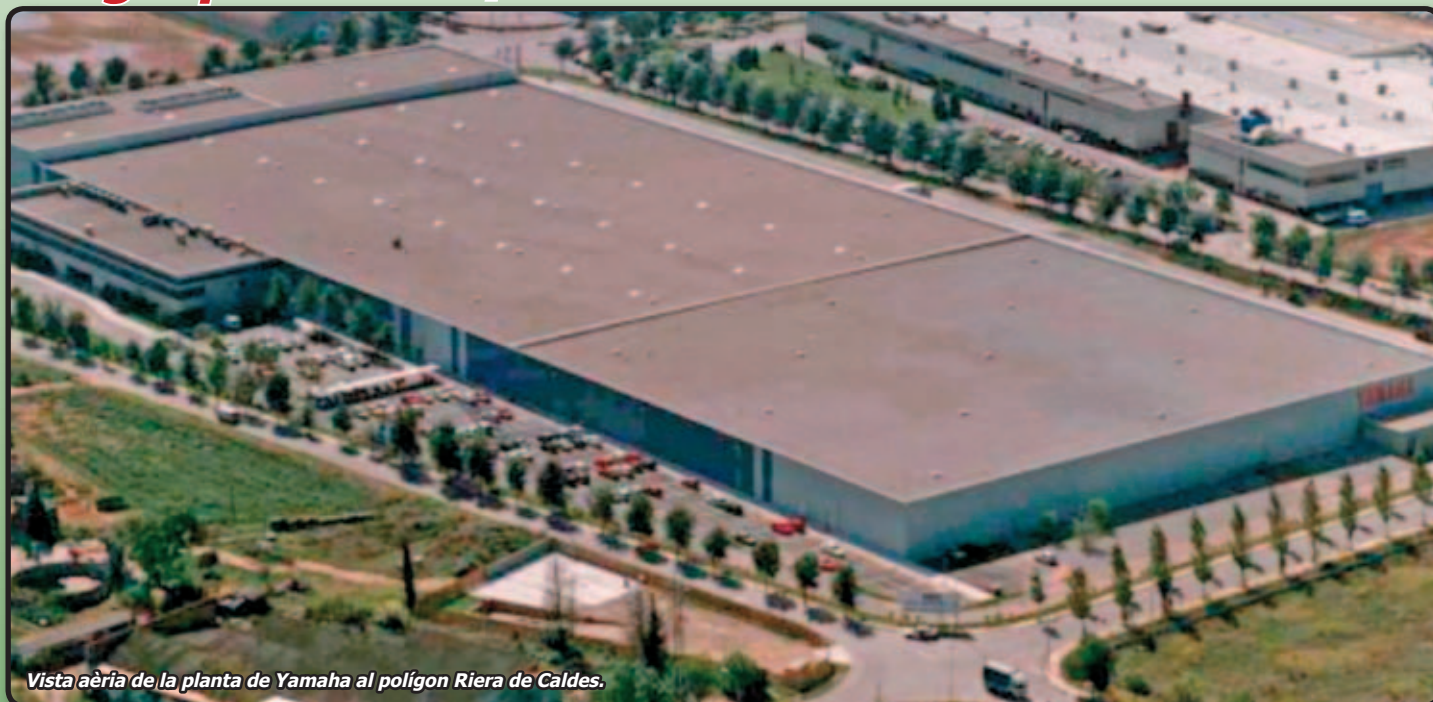
Vista aèria de la planta de Yamaha al polígon Riera de Caldes.

A la ja antiga planta de la multinacional Yamaha, ubicada al polígon Riera de Caldes de Palau, es podrien acabar fabricant cotxes, si es materialitzen les converses i si arriben a bon fi les intencions d'un grup inversor suís amb l'actual propietari de les instal·lacions, el grup de logística