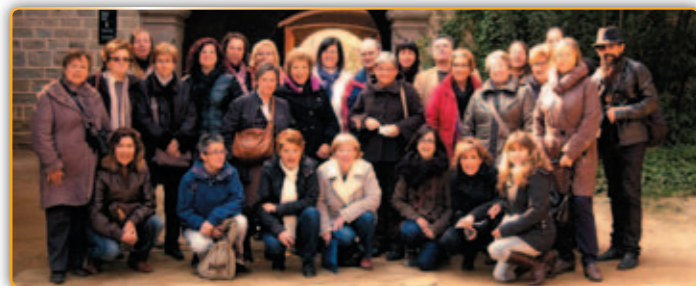
• Foto de família de les parelles del Voluntariat de la Llengua al Monestir.

El primer dissabte d'aquest mes de març, els membres i/o parelles que formen part del l'associació Voluntariat per la Llengua del Servei Lingüístic de Català (SLC) de Palau-solità i Plegamans van realitzar una sortida al Món Sant Benet, un complex lúdic i cultural que inclou el monestir de Sant Benet de Bages, que va ser adquirit per la família del pintor Ramon Casas. La visita estava organitzada per la regidoria de Cultura de l'Ajuntament s'emmarca dins les activitats de dinamització recollides dintre del programa Voluntariat per la Llengua que organitza el SLC de Palau. Un total de 26 persones, entre aprenents i voluntaris van prendre part en aquesta visita cultural guiada sobre l'època medieval i la fundació del monestir. Les parelles lingüístiques estaven acompanyats també pel regidor de Cultura, Miquel Rovira, i la professora i tècnica responsable del Voluntariat per la Llengua i del SLC del municipi.